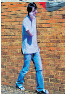
Papieren en digitale 'Street Ghosts'

Meer foto's en achtergronden vind je op streetghosts.net