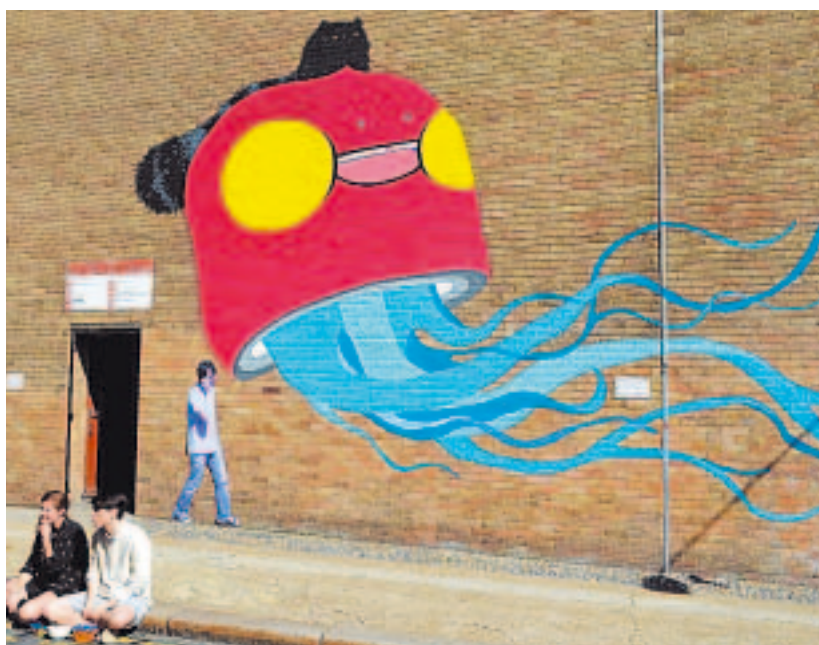
Pelas ruas. O artista italiano Paolo Cirio cria pôsteres de pessoas registradas acidentalmente pelo site e as fixa em seus "devidos lugares"

O artista se recusa a pedir permissão às autoridades locais, ao Google ou às pessoas convertidas em assombração.